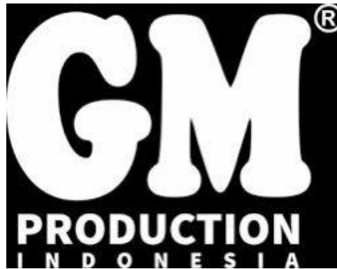
Gambar 1. Logo Perusahaan

Dengan jumlah karyawan kurang lebih 40 orang PT.GM Production memiliki misi menawarkan layanan rental service dengan kualitas bintang lima kepada client untuk membantu mengkonseptualisasikan dan mengaktualisasikan acara yang di inginkan. Dengan selalu memperhatikan tujuan strategis klien, kami percaya bahwa dengan membina kemitraan dan komunikasi yang kuat akan memastikan keberhasilan pelaksanaan setiap proyek.