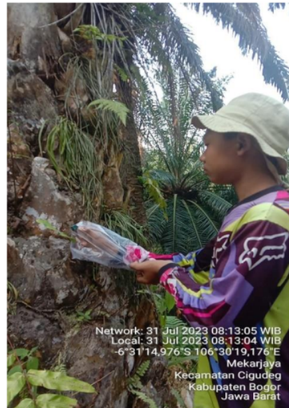
Gambar 6. Pengaplikasian Rodentisida

Cara pengendalian hama tikus secara kimiawi dapat menggunakan rodentisida antikoagulan yang berbentuk tepung berwarna biru untuk mengendalikan tikus Rattus argentiventer dan Rattus tiomanicus dengan cara dicampur dengan umpan. Cara membuat umpan Campurkan 2 kg ( \pm 10 gelas) bahan umpan (beras, jagung atau kedelai) dengan 20 ml (3 sendok makan) minyak goreng, aduk hingga rata, lalu campurkan 100g Racumin 0,75 TP Aduk kembali hingga rata. Warna birunya merata. Isi kotak umpan dengan 100 g umpan campuran Racumin 0,75 TP, letakkan umpan pada jarak \pm 50 meter dari tempat biasanya masing-masing tikus. Pemasangan umpan harus dilanjutkan sampai umpan tidak termakan. Ganti atau isi ulang jika umpan rusak atau kehabisan stok. Lindungi umpan dari air ataupun hujan.