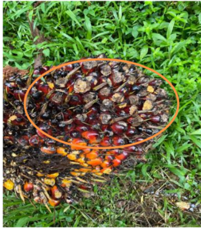
Gambar 5. Dampak serangan hama tikus pada buah kelapa sawit