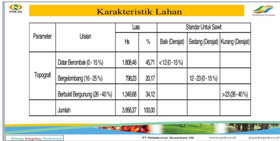
Gambar 2 Karakteristik lahan kebun Cikasungka

Sumber: PTPN VIII Kebun Cikasungka, 2022