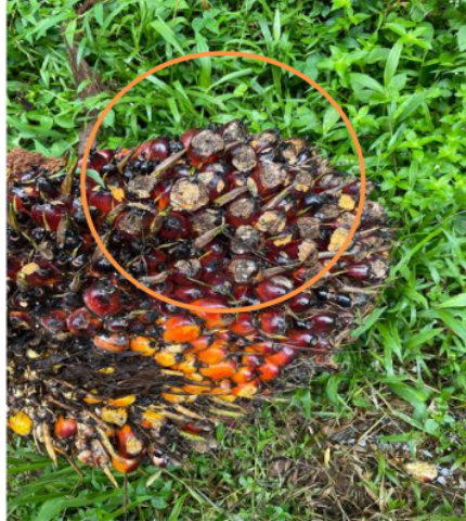
Gambar 4. Kerusakan buah kelapa sawit Oleh Tikus

Pada tanaman menghasilkan atau bisa disebut TM, tikus biasanya akan memakan bunga, buah, ataupun pucuk tanaman sehingga menyebabkan kehilangan hasil secara kuantitatif maupun secara kualitatif. Buah kelapa sawit yang busuk tertera pada Gambar 4.