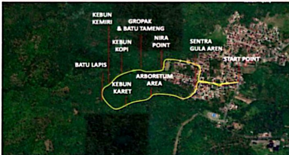
Gambar 1. Denah Lokasi Desa Wisata Sumber Agung Sumber : Dinas Pariwisata Kota Bandar Lampung (2021)

Desa Wisata Sumber Agung yang dilakukan oleh Dinas Pariwisata dan Kebudayaan Kota Bandar Lampung ini sangat cocok dijadikan sebagai bahan penelitian tugas akhir dibidang pariwisata.