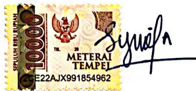
Syifa Nabila Putri

Bandar Lampung, 09 September 2022 Yang membuat pernyataan