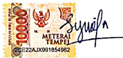
Syifa Nabila Putri

Bandar Lampung, 09 September 2022 Yang membuat pernyataan