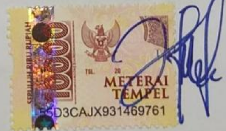
Haidar azmi rafifah

Bandar Lampung, 09 Agustus 2022 Yang membuat pernyataan