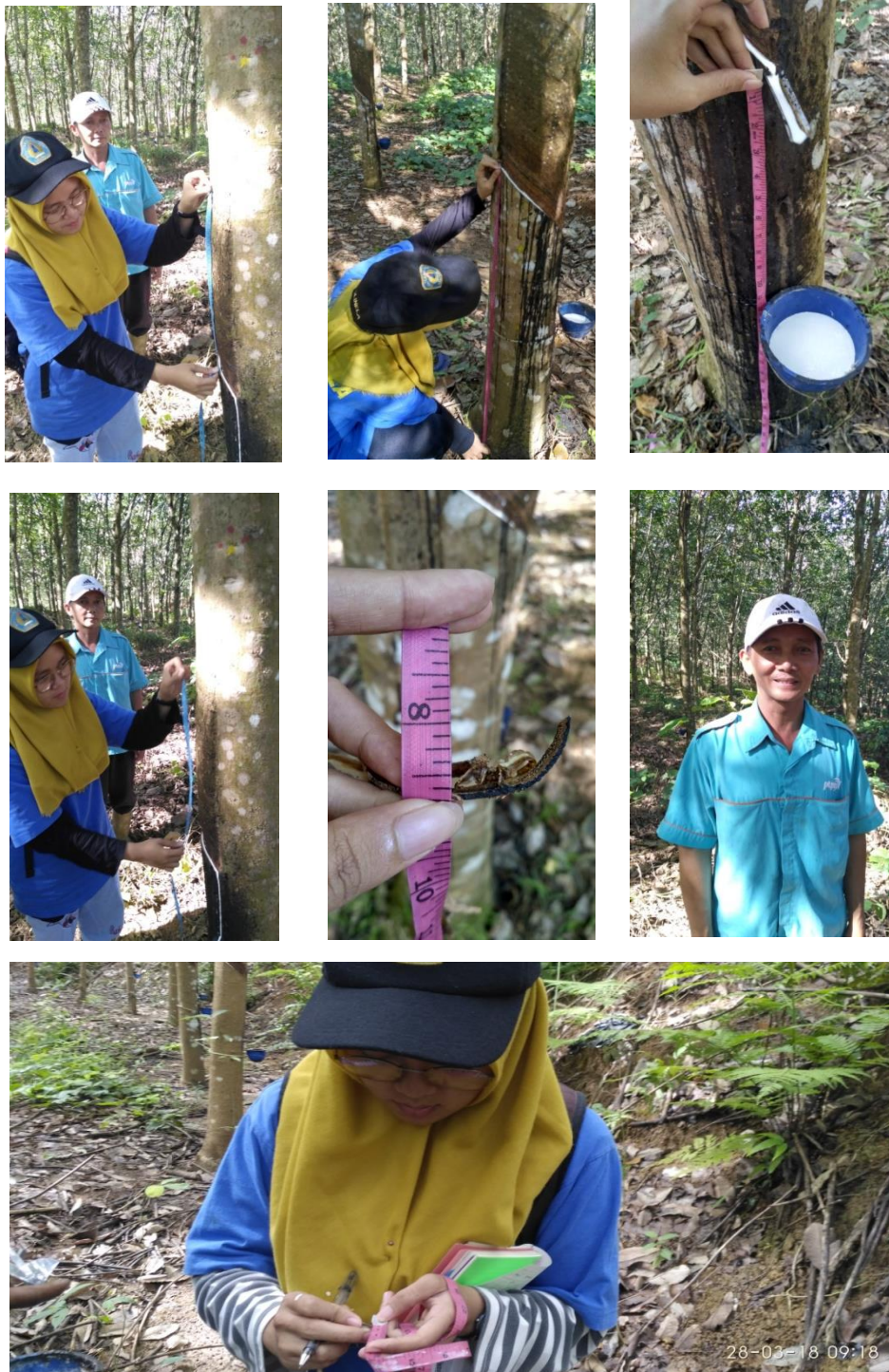
Gambar 9. Pengamatan konsumsi kulit pada afdeling IV Di PTPN VII Unit Ketahun